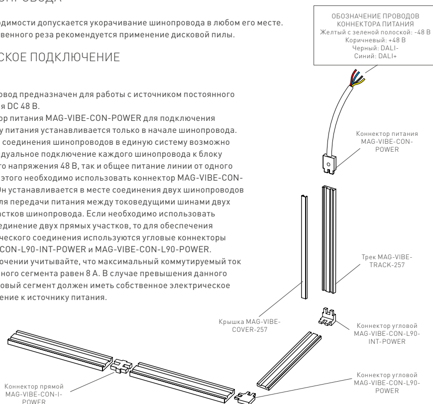
Рис. 2. Элементы и принцип построения разветвленной системы