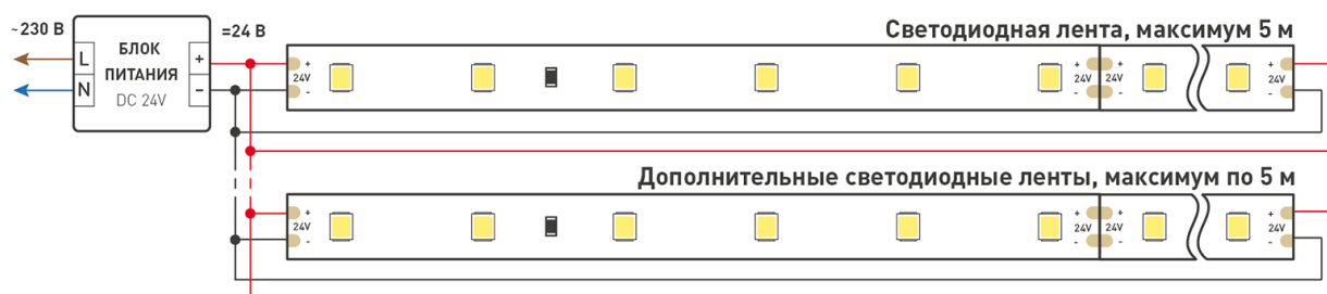
Схема 2. Подключение нескольких светодиодных лент с двух сторон.

Рекомендуется использовать для обеспечения равномерного свечения ленты по всей длине.