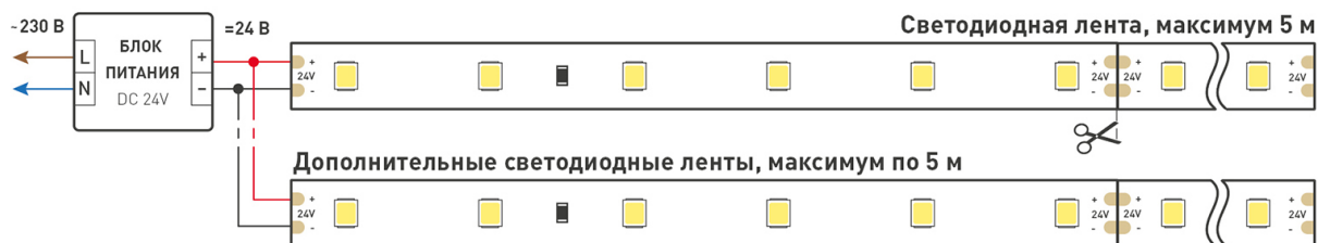
Схема 1. Подключение нескольких светодиодных лент с одной стороны.

Максимальная длина подключения ленты – 5 м (1 катушка).